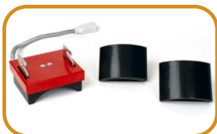
Abb. 6 · Kappenset