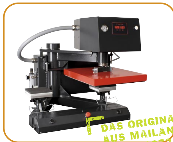
Abb. 2 · Brusttaschen-Druckplatten