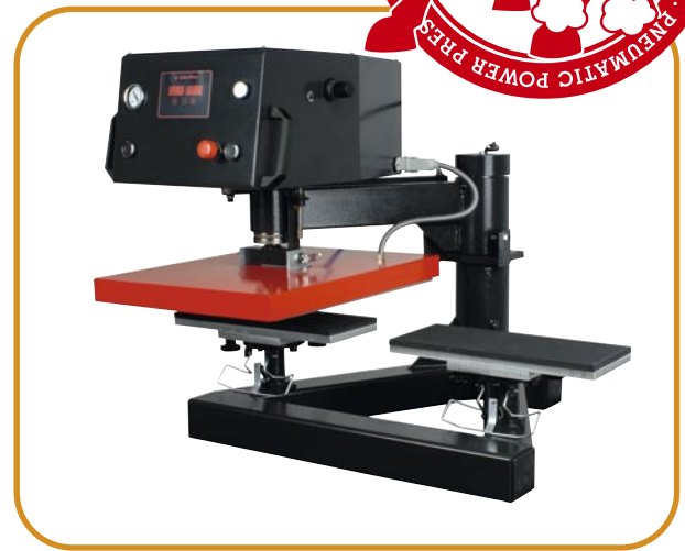
Abb. 3 · Ärmel- oder Hosen-Druckplatten · quer

Die Presse wird in ihrer Leistungskraft optimal unterstützt von unseren volumenstarken Kompressoren (siehe Seite 23).