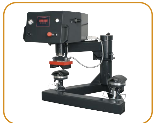
Abb. 5 · Kappenset