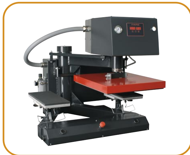
Abb. 3 · Ärmel- oder Hosen-Druckplatten · längs

Die Presse wird in ihrer Leistungskraft optimal von unseren Kompressoren unterstützt (siehe Seite 23).