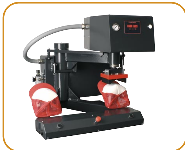
Abb. 4 · Kappenset