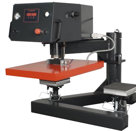
Abb. 2 · Brusttaschen-Druckplatten