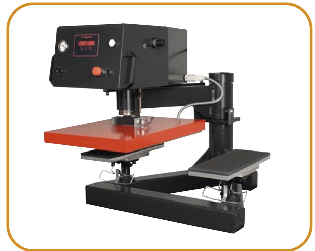
Abb. 4 · Ärmel- oder Hosen-Druckplatten · längs