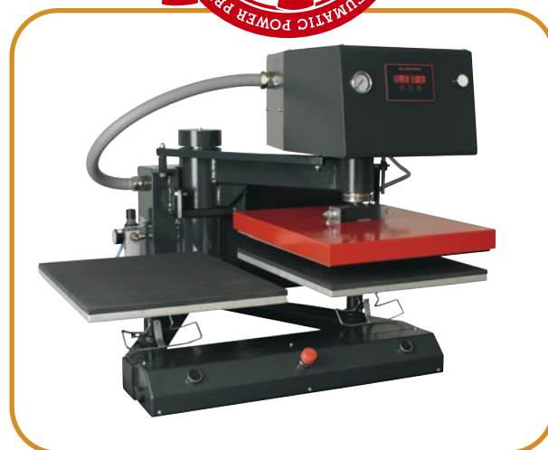
Abb. 1 · Standardausführung · Plattengröße 40 x 50 cm

Am übersichtlichen Digitaldisplay können Sie bequem die Transferzeit sowie die Arbeitstemperatur einstellen und überwachen. Dank der hochwertigen Heiztechnologie ist sowohl ein schnelles Aufheizen als auch eine gleichmäßige und konstante Arbeitstemperatur bei langer Lebensdauer der Heizelemente gewährleistet.