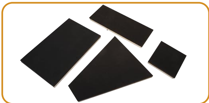
Abb. 7 · Girlie-Platte, längliche Platte, Schirm-Platte, Brusttaschen-Platte

Auf alle Lotus Pressen erhalten Sie 2 Jahre Garantie. Bitte beachten Sie auch unsere Gütesiegel.