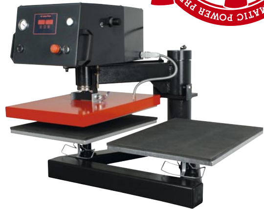
Abb. 1 · Standardausführung