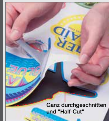
Ganz durchgeschnitten und "Half-Cut"

Die einzigartige Half-Cut-Funktion ermöglicht das perforierte Schneiden von Materialien. Dazu wird ein kleiner Steg nicht oder nur mit verringertem Andruck geschnitten, so dass der Aufkleber noch mit der Folie verbunden bleibt. Der einzelne Aufkleber kann leicht entnommen werden, bleibt aber auch beim Versand als Rollenware präzise an seinem Platz – das klappt auch bei Medien ohne Abdeckpapier.